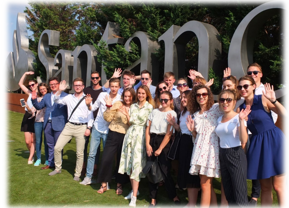
Wizyta studyjna studentów Uniwersytetu Ekonomicznego w Poznaniu w Santander Global Head Office, Boadilla del Monde (Hiszpania).

Więcej o naszym zaangażowaniu w edukację znajdą Państwo w raporcie rocznym CSR: raport.santander.pl