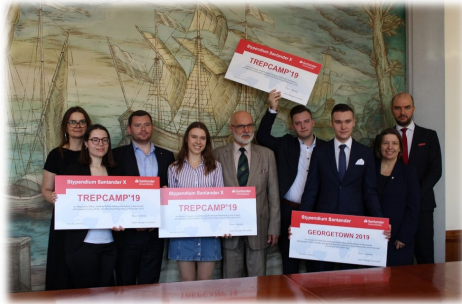
Wręczenie symbolicznych czeków finansujących uczestnictwo w programach globalnych dla studentów Szkoły Głównej Handlowej w Warszawie.