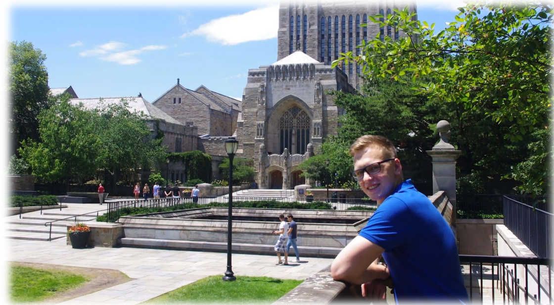
Student Gdańskiego Uniwersytetu Medycznego w trakcie programu globalnego organizowanego przez Santander oraz Yale University. Film zawierający wywiady z wybranymi beneficjentami programów globalnych w 2019: https://vimeo.com/393935886/15ef676969